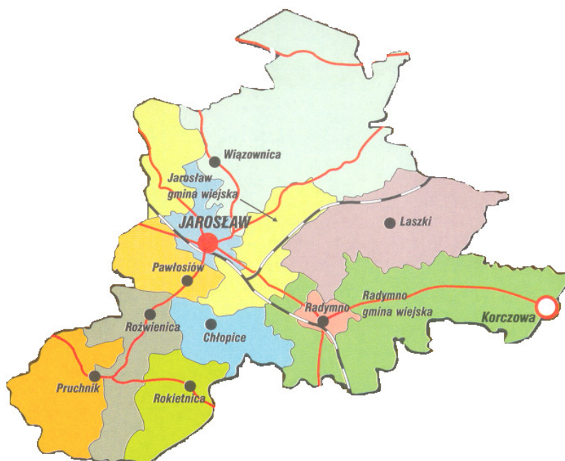
Mapa 1. Gmina Rokietnica na tle powiatu jarosławskiego

Gmina Rokietnica położona jest w południowej części powiatu jarosławskiego. Obszar gminy zajmuje 57 km 2 , co stanowi 5 735 ha; w tym jest 3 699 ha użytków rolnych, 1 708 ha lasów i 328 ha pozostałych gruntów. Rozległe kompleksy leśne obejmują południową część gminy.